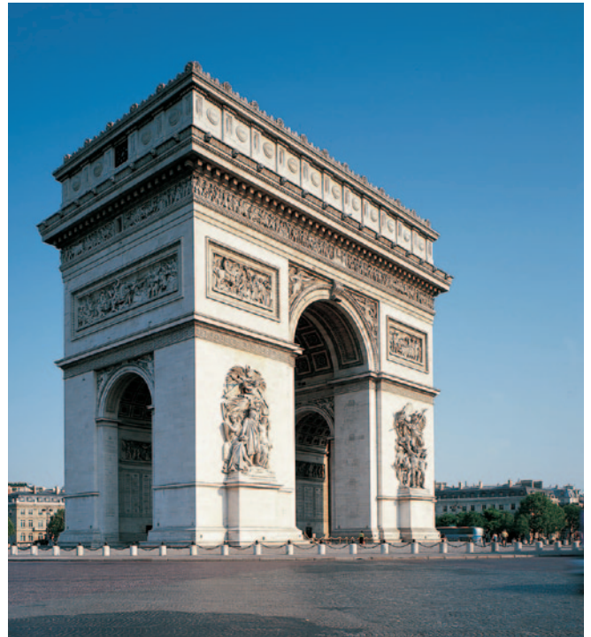
Durante el gobierno de Napoleón se edificaron arcos del triunfo al estilo de los romanos, como el arco del Triunfo de París.

En 1799, Napoleón fue nombrado primer cónsul, es decir, jefe de gobierno, durante tres años. Poco a poco, fue imponiendo un poder cada vez más dictatorial: en 1802 se proclamó cónsul vitalicio y en 1804 se coronó emperador, con el nombre de Napoleón I. El imperio perduró diez años.